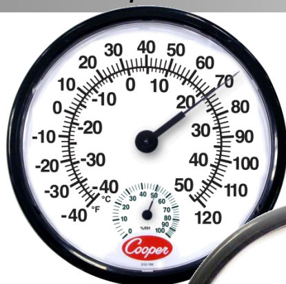
212-150 vnitřní/venkovní teploměr